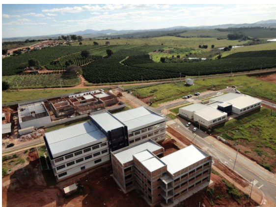
Pavilhões A e B, pavilhão C à frente e Clínica de Fisioterapia ao fundo (em construção)