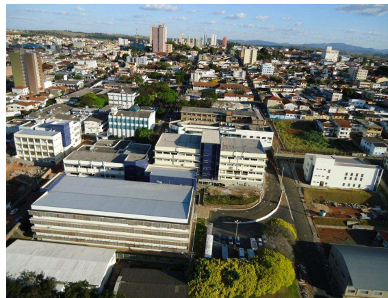
Vista parcial - em destaque o Pavilhão L à esquerda