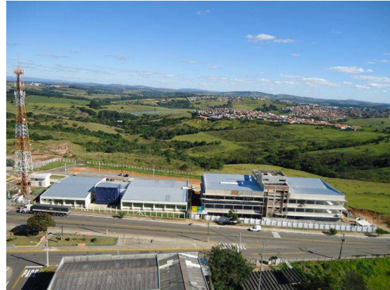
Pavilhões A, B e C