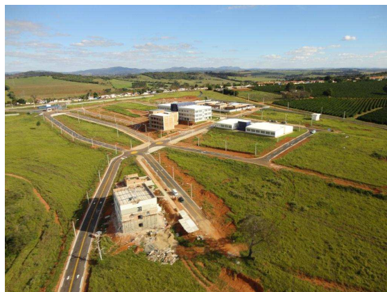
Vista geral da unidade