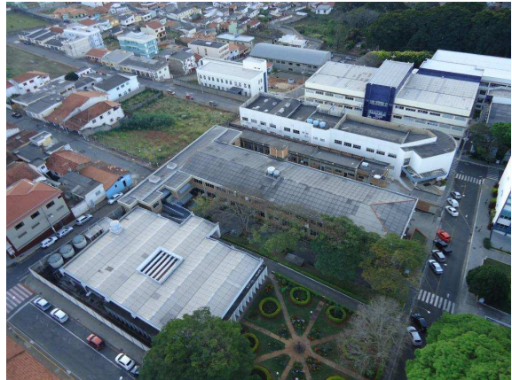
Vista parcial – em destaque ao fundo, Pavilhão V