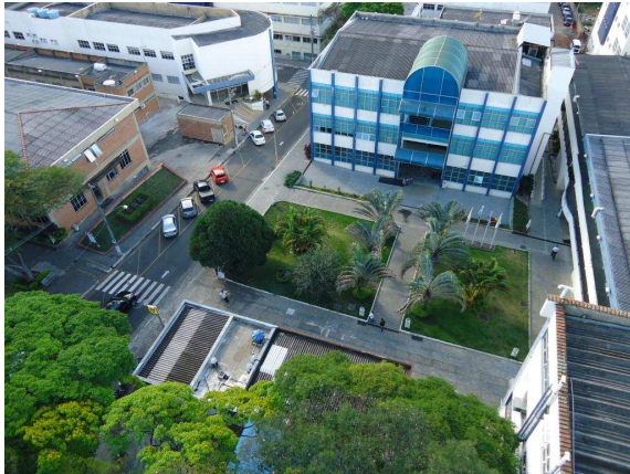
Pavilhão Central de Aulas