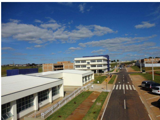
Acesso principal aos prédios A, B, C e à Clínica de Fisioterapia