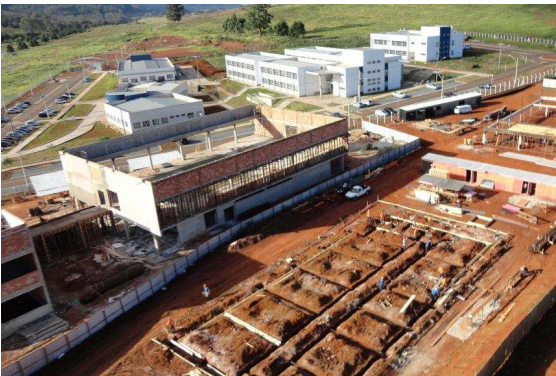
Vista geral dos prédios do Instituto de Ciência e Tecnologia e Laboratório de Pesquisa e Engenharia (em construção)