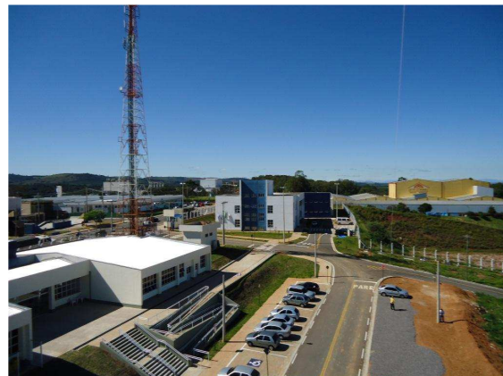
Pavilhões A, B e C