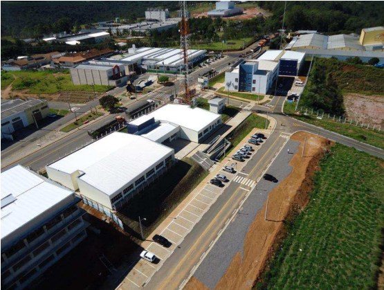
Vista parcial do prédio D (em construção) e Pavilhões A e D