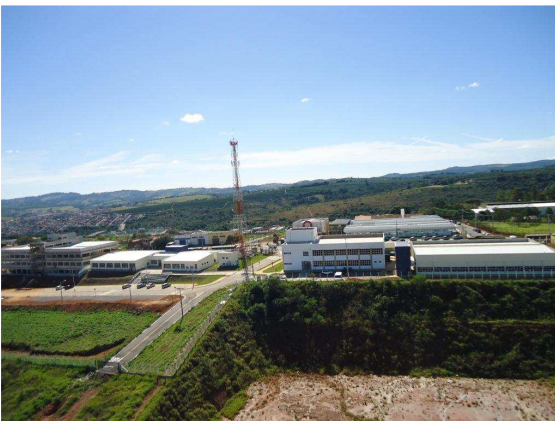
Vista lateral do campus