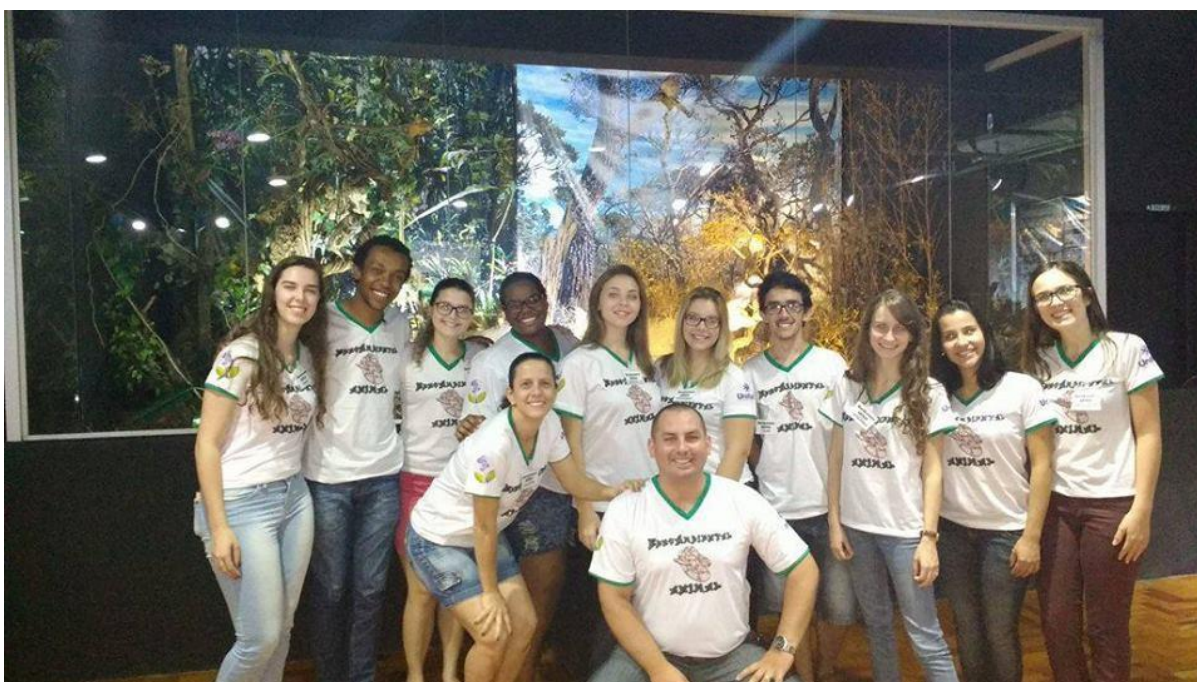
Fig.3 - Parte da equipe do projeto