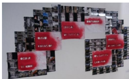
Figura 2 Resultado final do trabalho “Fluxo de benção” de Tainah Coutinho, em exibição no Salão “Nós de Aruanda” em 2016 na Galeria Theodoro Braga.