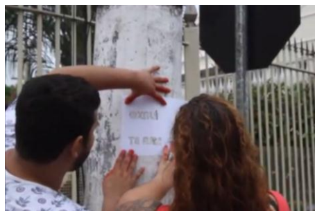
Figura 1 Execução do “Fluxo de benção” sendo realizado na cidade de Belém – “Oxalá te ama”. Retirado do vídeo do Youtube “Fluxo de Benção”, https://www.youtube.com/watch?v=oFOIFYAeNek .