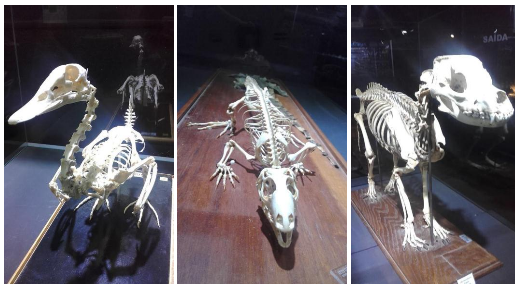
Fig.2- Parte do acervo de esqueletos do MNH-UNIFAL