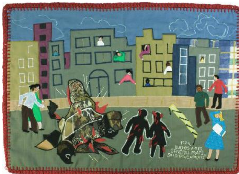
El largo brazo de la DINA I: Asesinato en Buenos Aires 42,9 x 60,4 x 0,6 cm

estivessem à espera do atentado ao voltar da esquina (ALLENDE, sem data, p. 192).