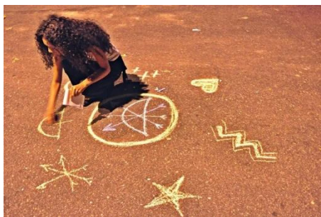
Figura 3 Obra “Poesia Riscada” produzida no evento Museu de Encruzilhada, em 2013.

Em relação a sua produção artística, apesar de não ter mencionado diretamente em sua entrevista, se relaciona ao universo simbólico e sagrado das religiões afro-brasileiras, principalmente pontos riscados e símbolos ligados às entidades cultuadas na Umbanda. Fazendo performances, riscando esses pontos na rua (Figura 3), fotografias, nas quais encontramos esses símbolos riscado em seu corpo, “Domínios riscados”. No ano de 2014, em sua obra no “Nós de Aruanda”, a artista fez carimbos com técnica de xilogravura e ofereceu cartões, onde as pessoas pudessem utilizar seus carimbos (Figura 4).