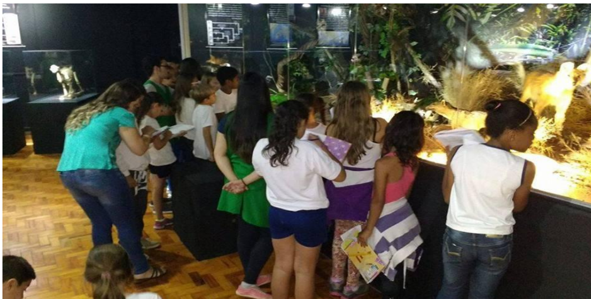
Fig.6- Público sendo monitorado durante a visita.