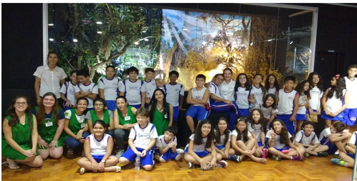
Fig.4- Visita de grupo escolar ao museu