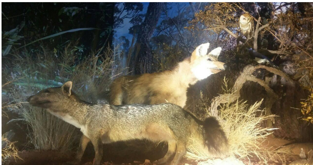
Fig.1- Diorama representando o cerrado do MHN-UNIFAL.

As visitas monitoradas acontecem com agendamento antecipado, de acordo com a disponibilidade do Museu e da equipe participante. Junto à exposição são fornecidas aos visitantes informações acerca da classificação biológica dos grupos de animais e também das técnicas utilizadas para conservação dos mesmos com o objetivo de exposições e estudo. As informações prestadas aos visitantes são adaptadas conforme o público específico de cada visita. Com isso, são desenvolvidas atividades variadas e oficinas, também conforme o grupo em questão, como aplicação de jogos envolvendo animais e suas características, contação de histórias, dinâmicas, atividades para colorir, entre outras.