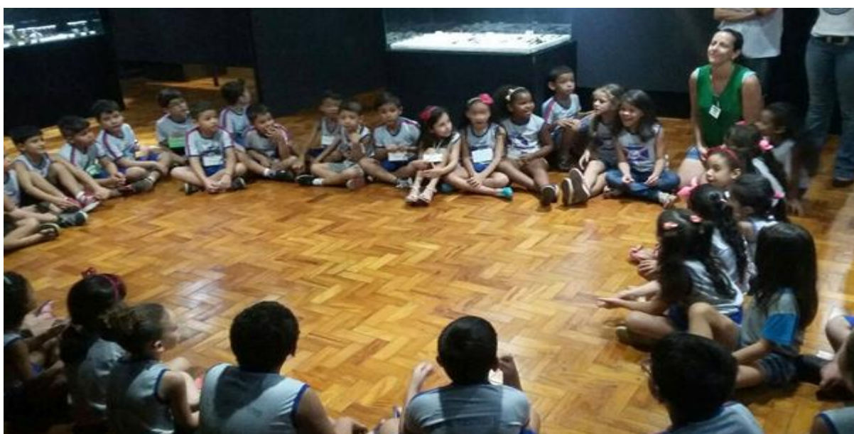
Fig.5 – Dinâmica aplicada em grupo