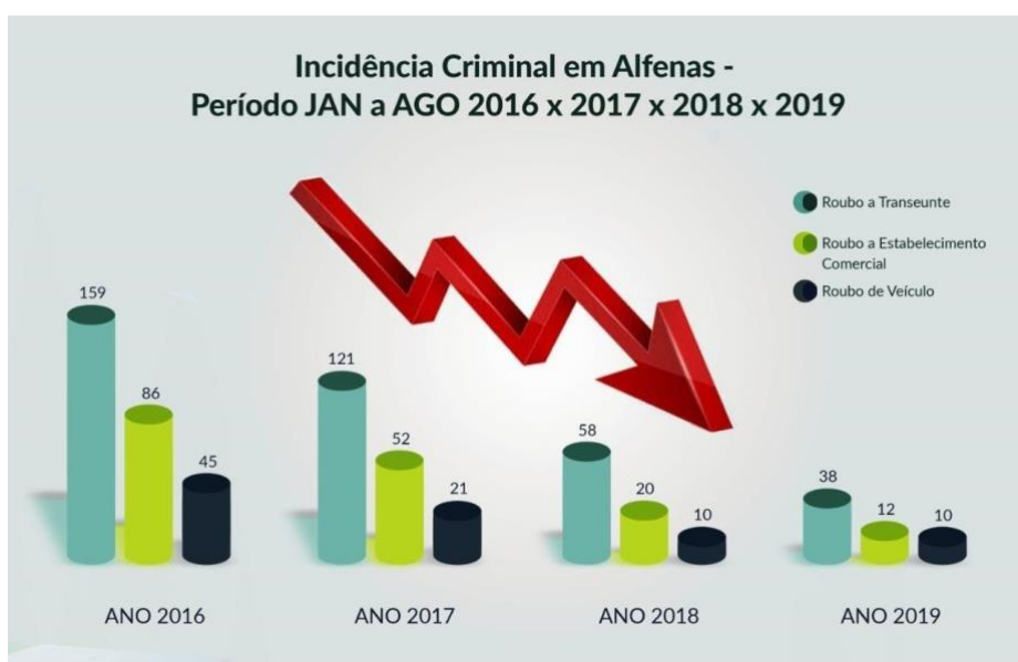
Figura 02: Índice Criminal de Alfenas - MG