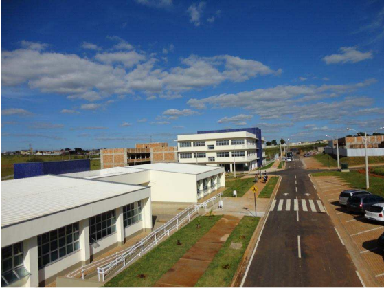
Acesso principal aos prédios A, B, C e à Clínica de Fisioterapia