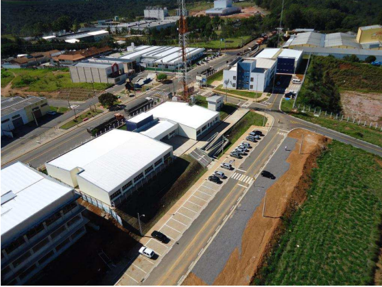
Vista parcial do prédio D (em construção) e E