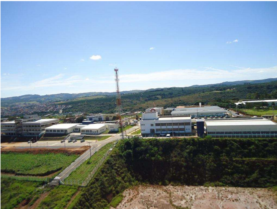
Vista lateral do campus