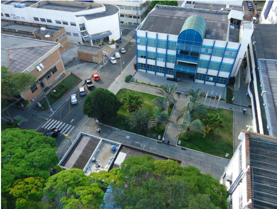
Pavilhão Central de Aulas