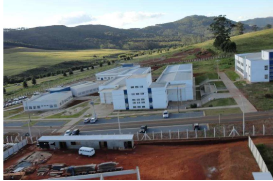
Vista parcial do campus