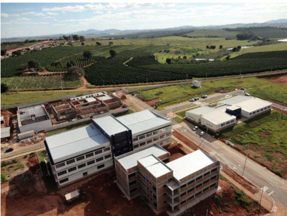
Pavilhões A e B, pavilhão C à frente e Clínica de Fisioterapia ao fundo (em construção)