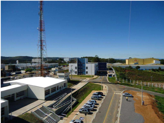
Pavilhões A, B e C