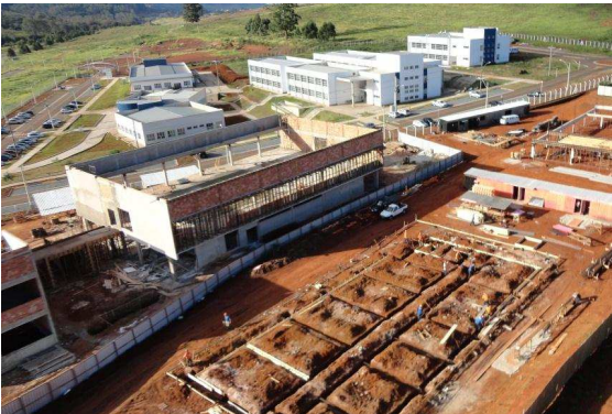
Vista geral dos prédios do Instituto de Ciência e Tecnologia e Laboratório de Pesquisa e Engenharia (em construção)