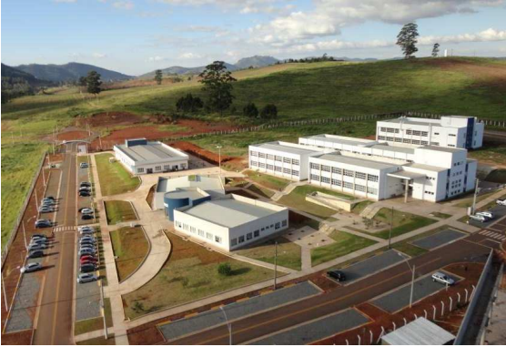
Pavilhões A, B, C, D e E