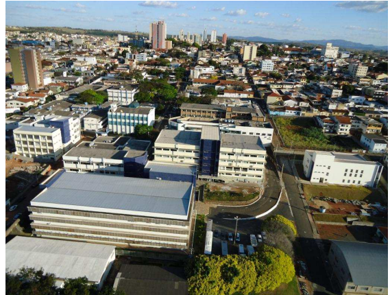
Vista parcial - em destaque o Pavilhão L à esquerda