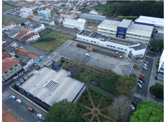
Vista parcial – em destaque ao fundo, Pavilhão V