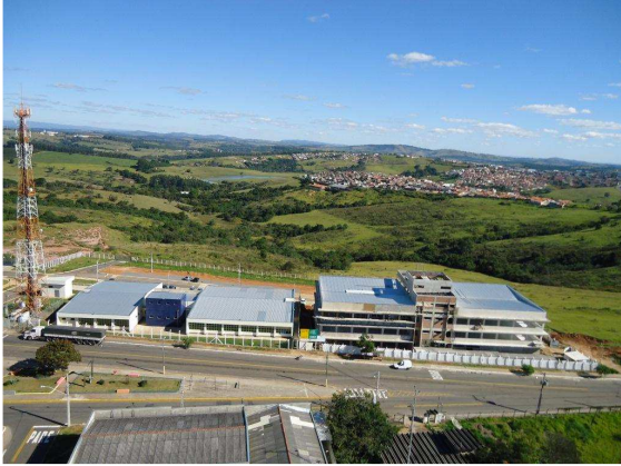
Pavilhões A, B e C