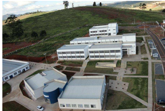
Vista parcial do campus