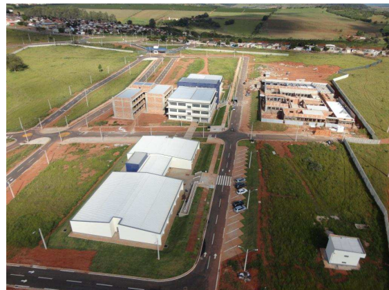
Vista geral da unidade