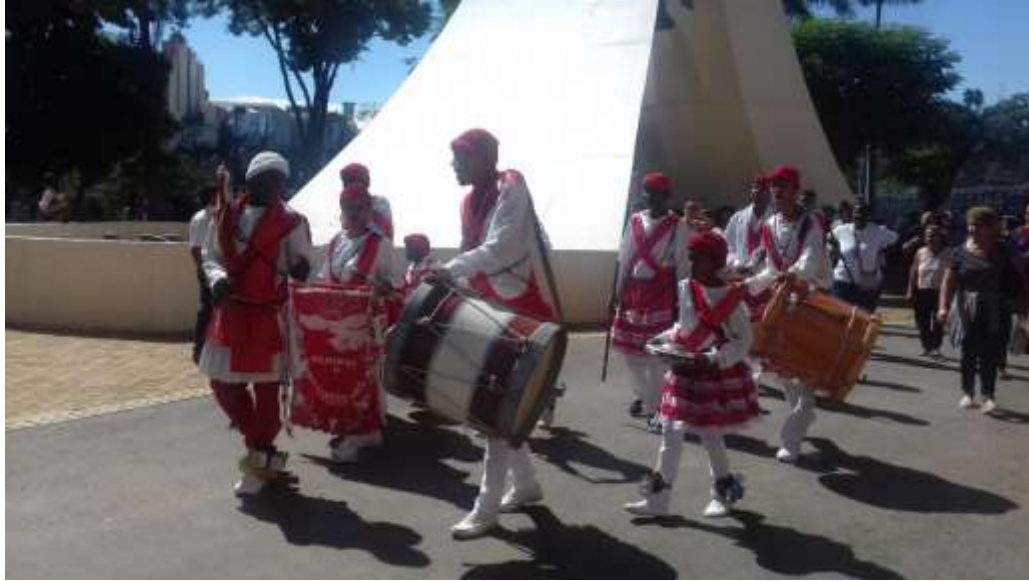
Figura 04- Terno de Congadeiros em Aparecida do Norte-SP, 2016.