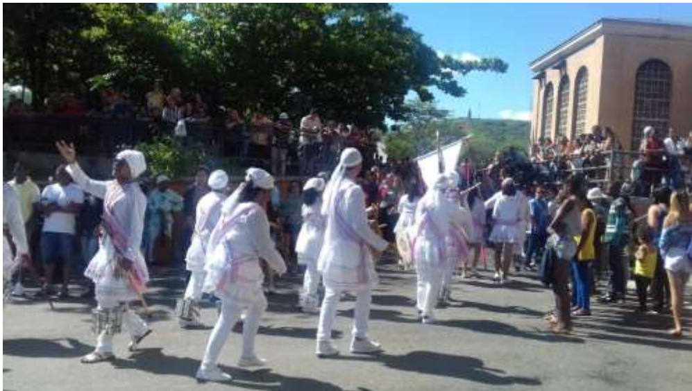
Figura 03- Terno de Congadeiros em Aparecida do Norte-SP, 2016.

A Entrevistada 16, 35 anos, dona de casa, afirmou que gosta muito da Congada, principalmente pela questão religiosa. Todos os anos ela vai ao ponto final dos congadeiros em Aparecida do Norte. (Figuras 03, 04 e 05)