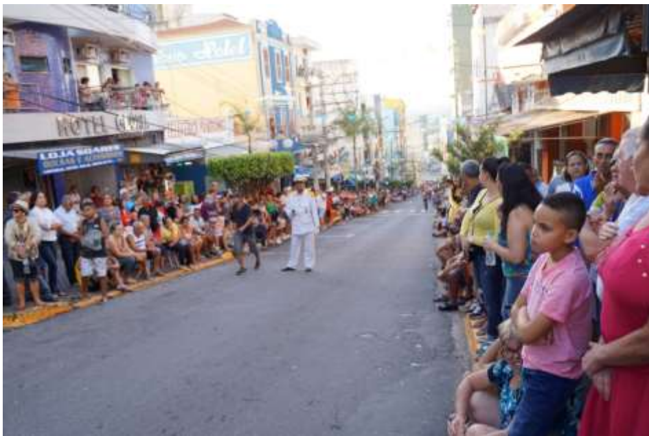
Figura 05- Pessoas esperando os Terno de Congadeiros em Aparecida do Norte-SP desfilarem, 2016.