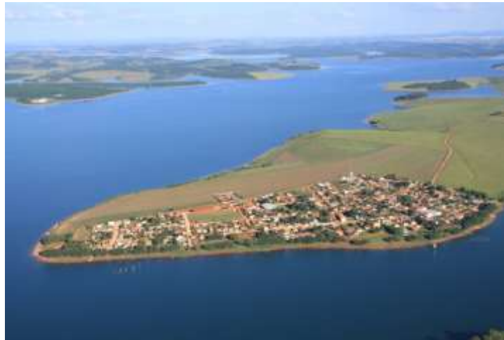
Figura 02- Foto aérea do espaço urbano do Distrito de Barranco Alto

A segunda alternativa seria percorrer a estrada pavimentada saindo de Alfenas, posteriormente passando pelos municípios de Areado (49km de distância do Barranco Alto) e Alterosa (36 km de distância do Barranco Alto), até chegar no distrito de Cavaco, pertencente a Alterosa (24km de distância do Barranco Alto, seguindo por uma estrada não-pavimentada até o distrito de Barranco Alto). (FIGUEIREDO, CRUZ E ALVES, 2016).