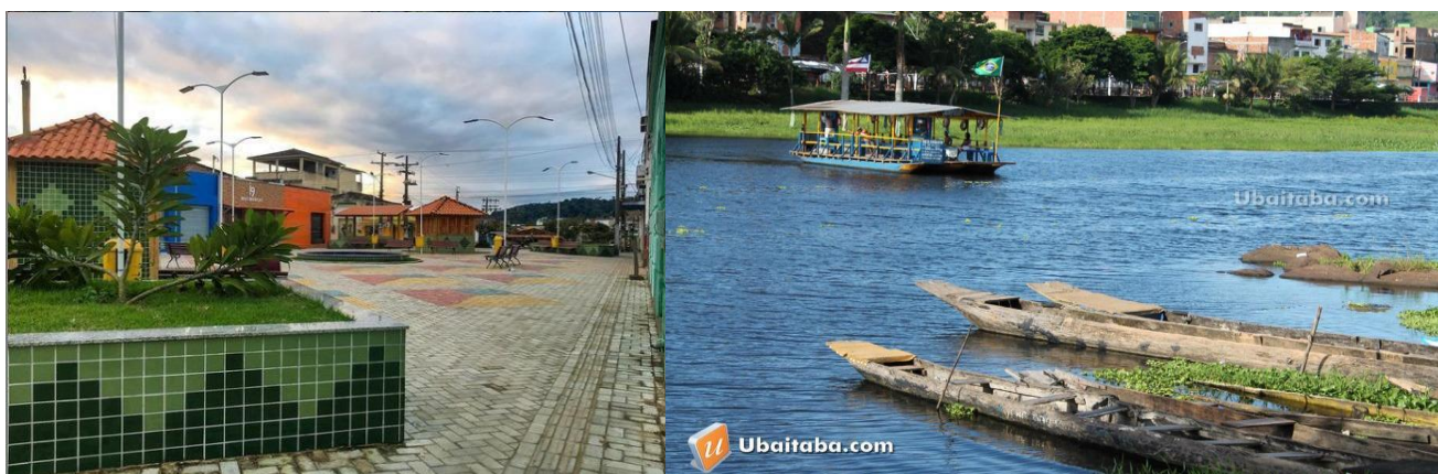
Figura 2 – Centro de Aurelino Leal-BA, fluxo e fixos.

O que na paisagem atual, representa um tempo do passado, nem sempre é visível como tempo, nem sempre é redutível aos sentidos, mas apenas ao conhecimento. Chamemos rugosidade ao que fica do passado como forma, espaço construído, paisagem, o que resta do processo de supressão, acumulação, superposição, com que as coisas se substituem e acumulam em todos os lugares. As rugosidades se apresentam como formas isoladas ou como arranjos. É dessa forma que elas são uma parte desse espaço-fator (SANTOS, p. 91).