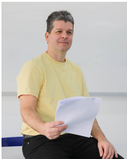
Para o pesquisador, se em 2013, representantes de direita e esquerda em certo momento estiveram juntas na rua, a partir de 2015, houve um acirramento político no país.

participação pessoal e ação direta. Em parte, a ida de setores médios mais conservadores às ruas, ao lado de movimentos de direita então em consolidação, como o Movimento Brasil Livre (MBL, que se aproveitou da semelhança com a sigla do autonomista MPL para ser seguido), construíram um discurso antipartidário (não apenas apartidário) e logo antipetista, tentando direcionar a energia dos protestos contra o governo federal do PT, com certo apoio das mídias comerciais – mas com sucesso relativo, ensaiando, entretanto, a estratégia que seria bem-sucedida em 2015 e 2016, nas manifestações pelo impeachment de Dilma Rousseff.