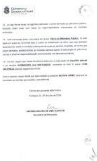
Figura 6 - Última folha de Notícia-crime, assinada pelo secretário