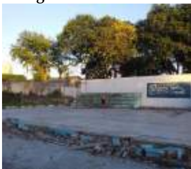
Figura 1 - Quadra esportiva, após varrição dos alunos.