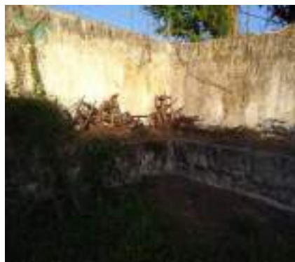
Figura 3 - Bebedouro da área externa