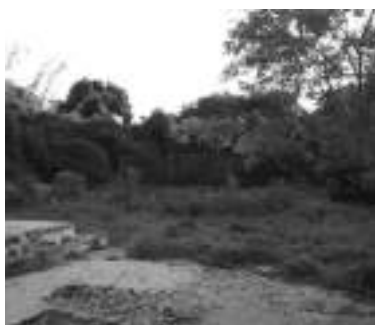
Figura 2: Área do campo de futebol. Ao fundo, o muro que separa a escola da Casa de José de Alencar, da Universidade Federal do Ceará (UFC)