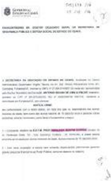
Figura 5 - Capa de Notícia-crime