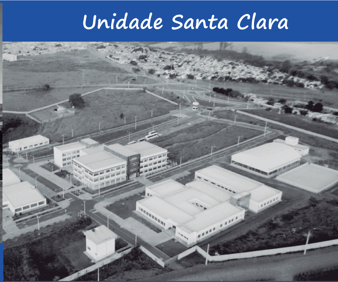
Unidade Santa Clara