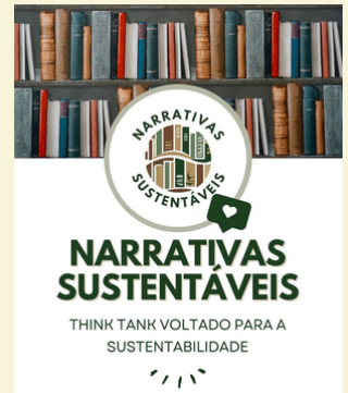
Imagem: do Projeto Think Tank

Em Poços de Caldas, o projeto de extensão THINK TANK : Grupo de Reflexão sobre Narrativas Sustentáveis tem promovido ações de sensibilização ambiental que aliam literatura, debate e práticas educativas. No último trimestre, os temas trabalhados incluíram refugiados ambientais, greenwashing , moda e sustentabilidade, estimulando a comunidade acadêmica e externa a refletir sobre os impactos das práticas humanas no meio ambiente. Para acompanhar os conteúdos e participar das discussões, siga o perfil do projeto no Instagram: @narrativassustentaveis